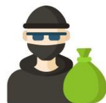
Кража данных пользователей